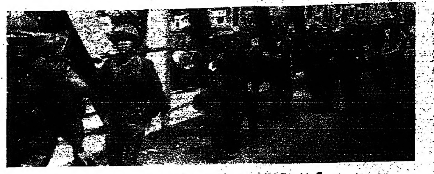
توار «التيكونغ» بعد سيطرتهم على مدينة «هوي»

السرية المزدوجة بالصواريخ ، التي قاعدت تربية من نيتام الجنوبية . الهجوم مستمر على فتومينيه . و في فتومينيه ، اعلان ان معارك القوات الحكومية هوجماً مضاداً يقصف التسليح من العاصمة ، وعلى السفن الشراعية تهر يتكون على بعد ثلاثة كيلومترات من قلب فتومينيه . وتدور المعارك من اجل موقع رئيسي يقع على بعد ستة كيلومترات من فتومينيه كانت قوات التوار قد استولت عليه خلال الليل . وشنقت القوات الحكومية هوجماً مضاداً يقصف مخيم شديدة اضعف مضاداً يقصف . وقالت مصادر عسكرية انه اذا لم يسرد الموقع قبل حلول الظلام فان التوار سيمزجون مواقعهم ويضربون تمزيقات ، وبذلك يشكلون تهديدا خطيراً على شواهي العاصمة الشمالية . وفي باتوك ، اعلان ناطق بلسان وزارة الخارجية مساء امس ، انه قد تجري محادثات سرية اخرى بين حكومة فتومينيه ومعارضها في اعقاب اجتماع تجديدي عقد ليل الاثنين الماضي . سايفون ، واشنطن ، فتومينيه - ر. ا.ب.